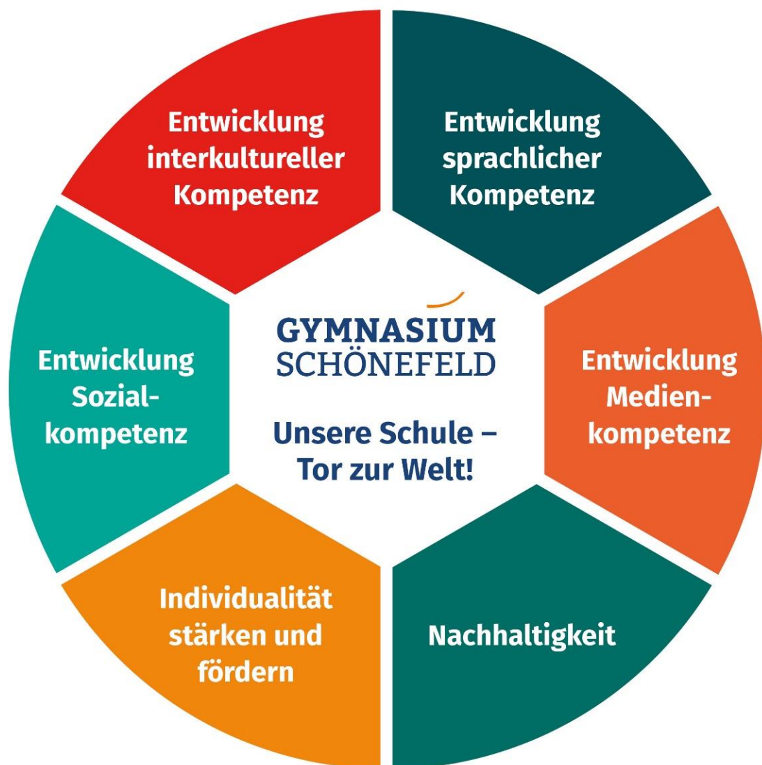
Abbildung 2: Die sechs Säulen der pädagogischen Grundorientierung

Ausgehend von unserem Leitbild zeichnet sich unsere pädagogische Arbeit durch insgesamt sechs Schwerpunkte aus. Diese Schwerpunkte bilden die Säulen sowohl unserer unterrichtlichen als auch der außerunterrichtlichen Tätigkeiten. Ebenfalls ist die Zusammenarbeit mit unseren außerschulischen Partnern im Rahmen von Kooperationen entscheidend von diesen sechs Schwerpunkten geprägt. Die folgende Abbildung stellt die sechs Säulen dar.