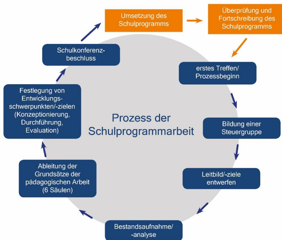
Abbildung 3: Prozess der Schulprogrammarbeit

Die Evaluation einzelner Entwicklungsvorhaben und -ziele wird regelmäßig nach der Durchführung erfolgen. Da wir uns als Schule im Aufbau und damit als junge Schule kurzfristig weiterentwickeln werden, werden die Fortschreibung und die interne Evaluation des Schulprogramms zu stetigen Aufgaben unserer schulischen Arbeit. Aus diesem Grunde wird es halbjährlich ein Treffen der Steuergruppe geben. Den gesamten Prozess der Schulprogrammarbeit zeigt die folgende Abbildung 3.